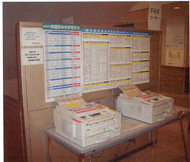
（写真 2：院外処方 FAX コーナー）

最後に、学校薬剤師活動について紹介します。これは、毎年釧路薬剤師会の事業として参加しているものです。今年は釧路市内の 3 つの中学校、7 つの小学校及び養護学校と幼稚園各 1 施設に直接出向いて学校環境衛生検査を行っています。具体的には、二酸化炭素、湿度などの空気検査、保健室のベッドのダニ検査、各種教室の照度検査等です。小中学校などに薬剤師が実際に出向いて、公衆衛生の向上及び増進に寄与することにより地域に貢献しています。