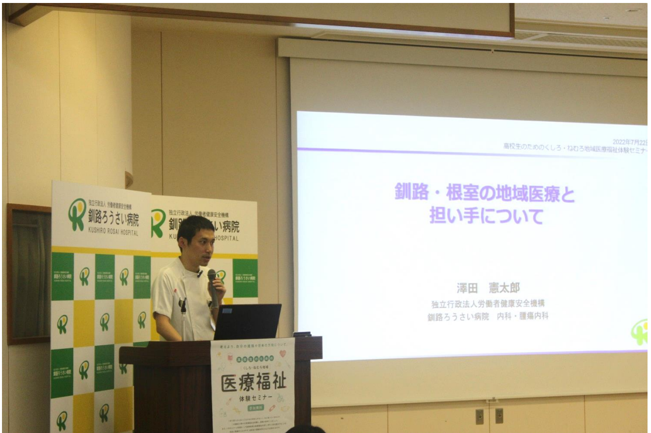
講演（澤田腫瘍内科部長）