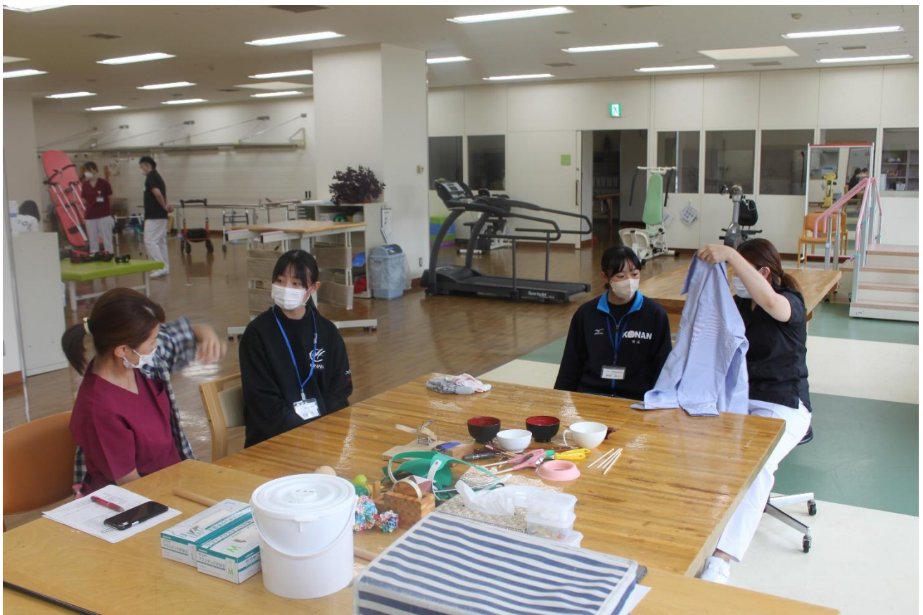
リハビリ模擬体験