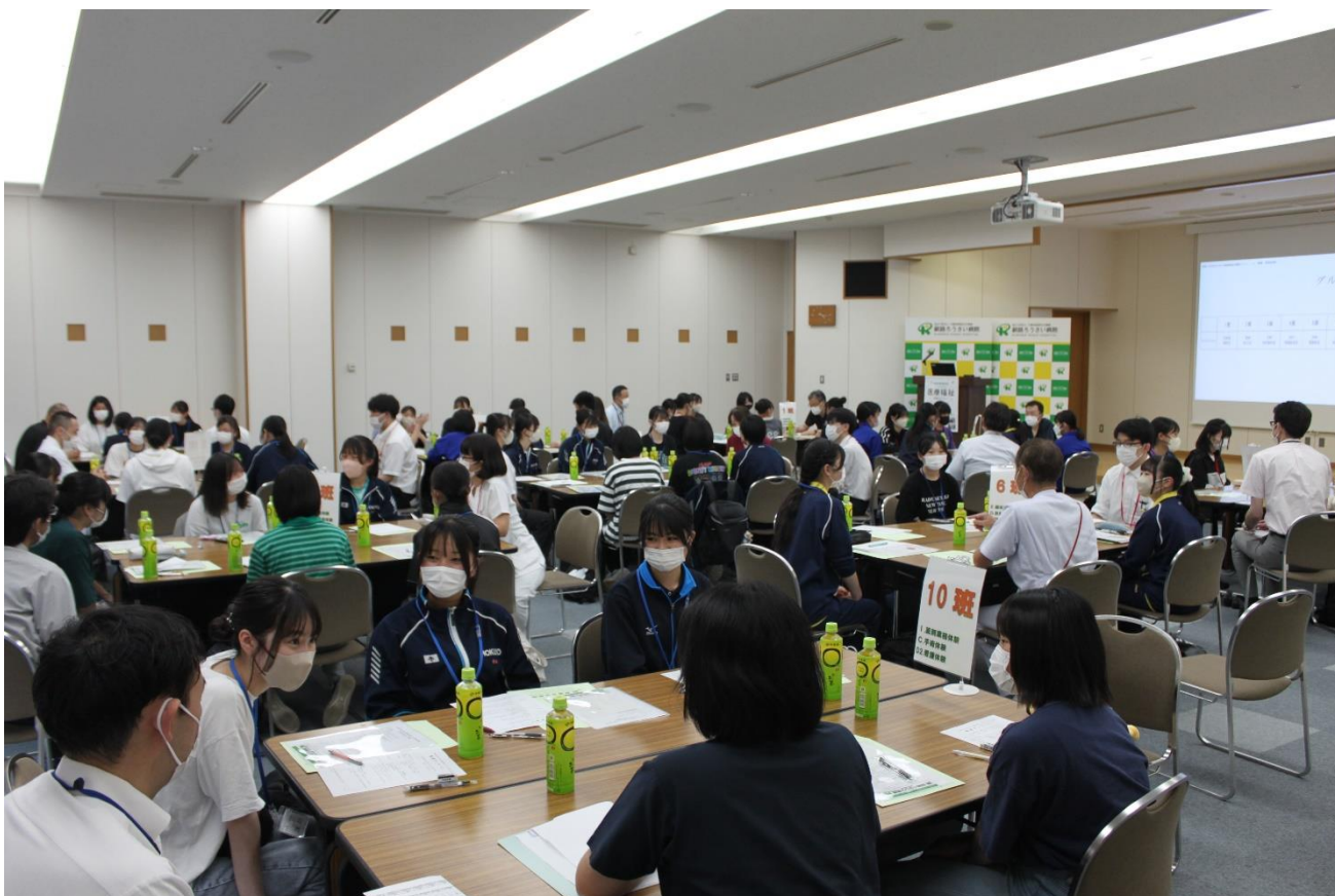
医療体験後のグループディスカッション