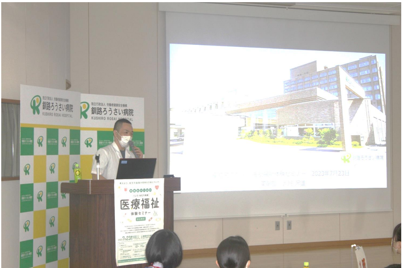
講演（大月薬剤部長）