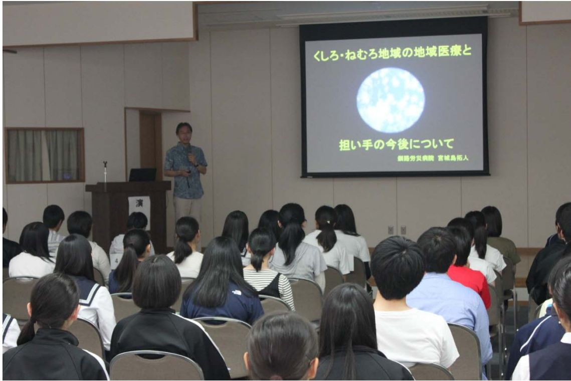
宮城島副院長 講演