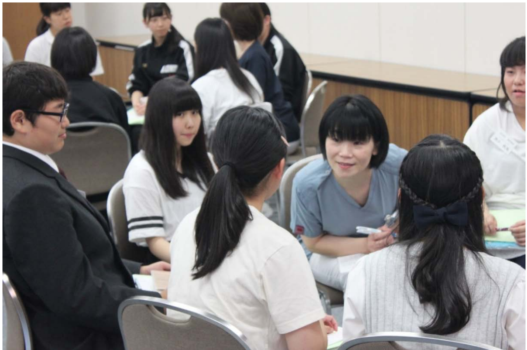
ディスカッション