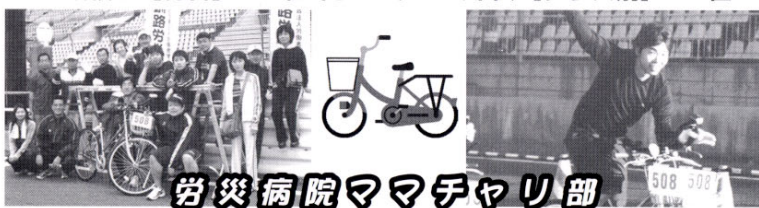
労災病院ママチャリ部